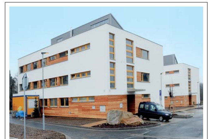
Akciová společnost ZVVZ MACHINERY vyrobila a dodala prostřednictvím Průmstavu Praha vzduchotechnická zařízení na stavbu Krajiněho parku Telč - Pavilonu vysokoškolských kolejí (na snímku). Součástí dodávky byl ventilátor APH 2240 se vzduchotechnickou měřicí sekcí. Do provozu bude uvedeno na jaře 2012. Vybavení je součástí komplexu, sloužícího k výzkumným programům jakými jsou modelování chování historických i moderních materiálů a konstrukcí při synergickém působení klimatických činitelů nebo modelování působení větru, ale i tepla a deště, na stavební objekty a památky.

ZVVZ ENERGO, s.r.o. vzniklo v lednu 2009, a je součástí akciové společnosti ZVVZ GROUP. Pro skupinu zajišťuje veškeré „energetické“ služby, jako dodávky a rozvod elektrické energie, tepla, vody, vzduchu a technických plynů. Od ledna 2010 pak firma převzala také výrobu a dodávky tepla do centrálního zásobování města Milevsko, když rok před tím vyhrála vyhlášené výběrové řízení na provozování městského tepelného hospodářství.