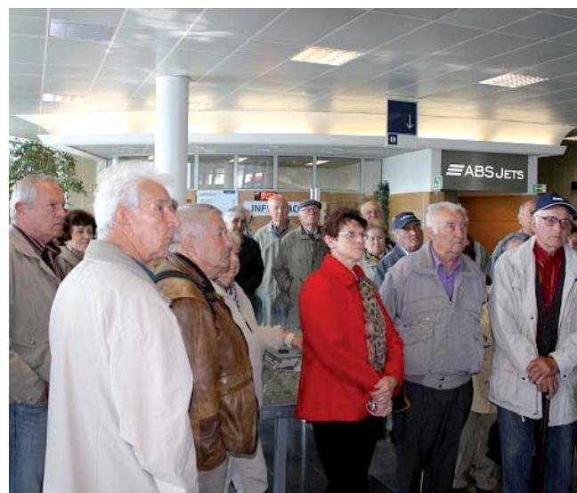
Při návštěvě pražského letiště Ruzyně

Senior klub ZVVZ má kolem 400 členů a svá setkání pořádá už jedenáct let. Jeho činnost se zaměřuje na vzdělávání, kulturně poznávací zájezdy, rekreaci a společenské akce. O činnosti Senior klubu ZVVZ se lze rovněž dozvědět v městském Zpravodaji, ve vývěškách a na webu www.skzvvz.pisecko.info