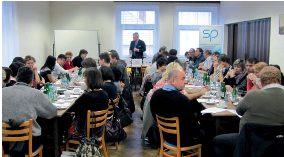
Seminář Problematika DPH ve vztahu k zahraničí

Projekt Udržitelnost sociálního dialogu je realizován v rámci OP LZZ pod záštitou Svazu průmyslu a dopravy ČR (SP) začal v roce 2010 a potrvá do května 2013. Jeho cílem je kromě zkvalitnění sociálního dialogu mezi zaměstnanci a zaměstnavateli, také rozšíření znalostí, profesních kompetencí a schopností zaměstnanců a zaměstnavatelů a rozvíjení systému dalšího vzdělávání formou vzdělávacích