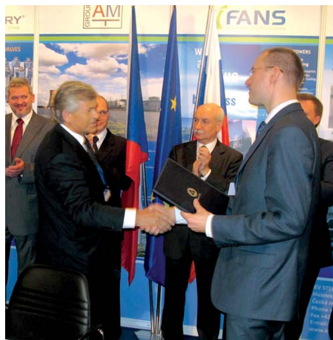
... a s generálním ředitelem Sergejem Kirijenkem při výměně dokumentů

kém průmyslu,“ řekl šéf Rosatomu Sergej Kirijenko. Ten předpokládá, že 70 procent hodnoty zakázky v rámci případné do- stavby JE Temelín by zajišťovala české firmy. To by znamenalo zhruba 4 až 5 miliard eur a práci pro 10 až 20 tisíc lidí.