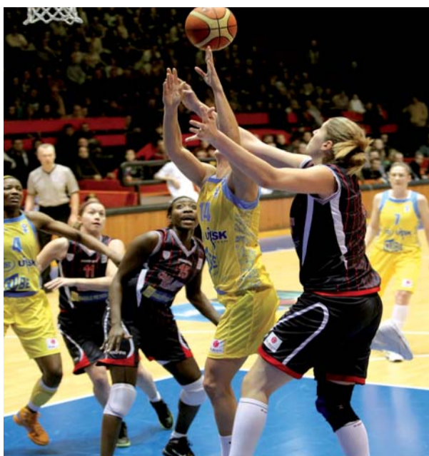
Dramatické osmifinále s CB Taranto vyhrály v Praze šťastnější Italky

Body pro jednotlivé kluby se rozdělují za výsledky v domácí lize a na základě výsledků v evropských pohárech. Závisí i na bodovém koeficientu, který země získaly v předchozích letech. Mužům vládne Barcelona, ženám pak Jekatěrinburg.