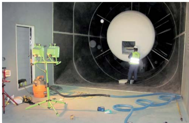
Dokončovací práce na mechanických částech oběžného kola