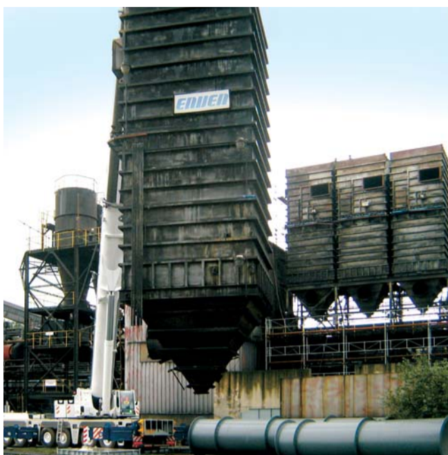
Demontáž stávajícího odprašovacího zařízení

Původní zařízení dodávané v minulosti firmou Enven bylo nahrazeno novým látkovým fil-