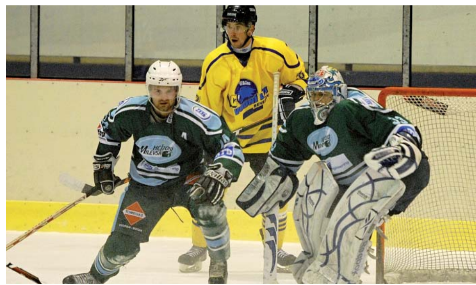
HC Milevsko 2010 vs. HC Vodní lvi Benešov

podlehli v obou střetnutích. Milevsko bylo Benešovu víc než vyrovnaným protivníkem, když ho v obou zápasech výrazně přestřílelo. V zakončení se ale už projevila menší zkušenost. Celkově lze hodnotit sezónu jako úspěšnou. Nově vytvořený klub zvládl všechna úskalí vzniku a velmi dobře se prezentoval jak v kategorii dospělých, tak mládeže. Především však nastavil systematická pravidla pro rozvoj hokejové mládeže ve městě.