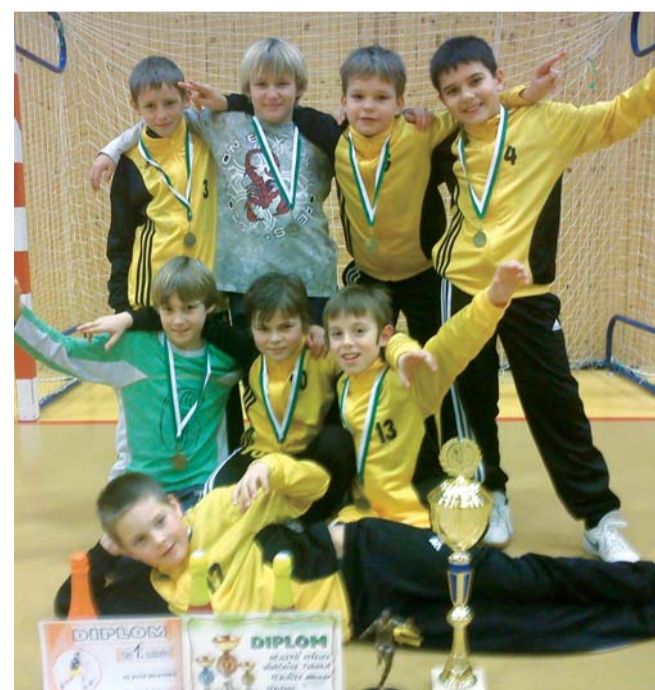
Vítězné foto starší přípravky A z turnaje ze Sedlčan