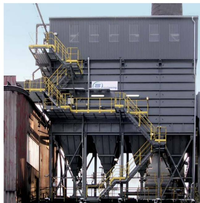
Nové látkové filtry pro zařízení koksárenské baterie číslo 12

tím dvou kusů stávajících ventilátorů (RVM 1600), kdy jeden slouží jako stoprocentní záloha. Naše dodávka garantuje maximální úlet tuhých znečišťujících látek z filtračního zařízení ve výši maximálně 10 mg/Nm 3 při dodržování zadaných vstupních parametrů.