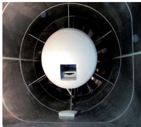
Pohled na montážní otvor náboje oběžného kola

dodávka obřího ventilátoru pro aerodynamický zkušební tunel německé automobilky Audi v roce 2007. Tím se společnost zařadila mezi elitu firem, které se ventilátorům pro tyto druhy tunelů věnují. U lopatek z extrémně lehkých karbonových vláken, které použila už v dodávce pro Audi, dokonce určuje jejich standard.