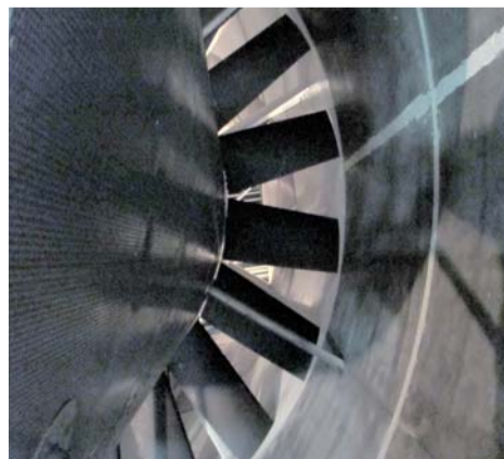
Pohled na karbonové lopatky